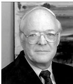
จอห์น เนฟฟ์ (John Neff)

“ซื้อหุ้นที่ใคร ๆ ไม่ชอบไม่รัก และขายตอนที่ราคาปรับขึ้นจากการที่นักลงทุนคนอื่น ๆ กลับมาเห็นคุณค่าของมัน ด้วยวิธีนี้คุณจะได้กลับบ้านพร้อมผลตอบแทนที่น่าพอใจ”